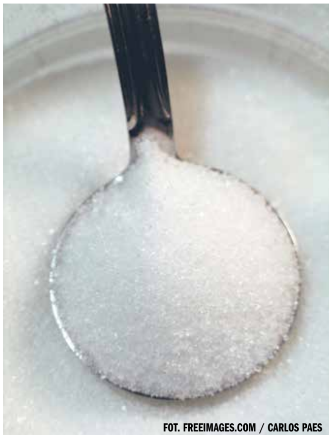
FOT. FREEIMAGES.COM / CARLOS PAES

PAP - NAUKA W POLSCE, ZBIGNIEW WOJTAŚIŃSKI ŹRÓDŁO: SERWIS NAUKA W POLSCE - WWW.NAUKAWPOLSCE. PAP.PL