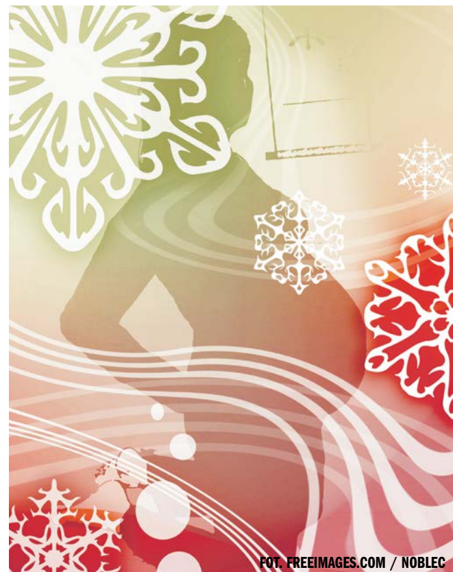
FOT. FREEIMAGES.COM / NOBLEC

PAP - NAUKA W POLSCE, ZBIGNIEW WOJTASIŃSKI ŹRÓDŁO: SERWIS NAUKA W POLSCE - WWW.NAUKAWPOLSCE. PAP.PL