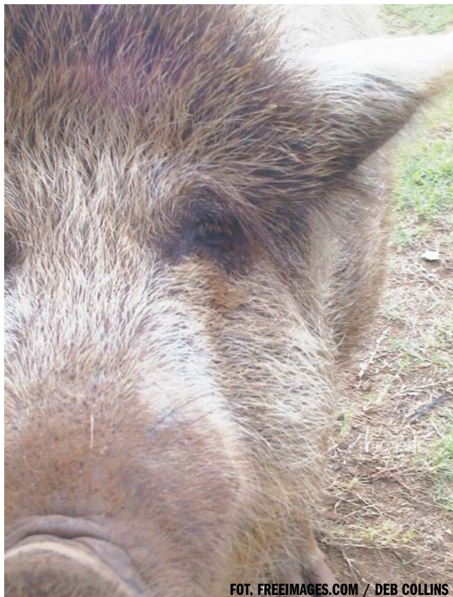
FOT. FREEIMAGES.COM / DEB COLLINS

PAP - NAUKA W POLSCE, KATARZYNA FLORENCKA ŹRÓDŁO: SERWIS NAUKA W POLSCE - WWW.NAUKAWPOLSCE. PAP.PL