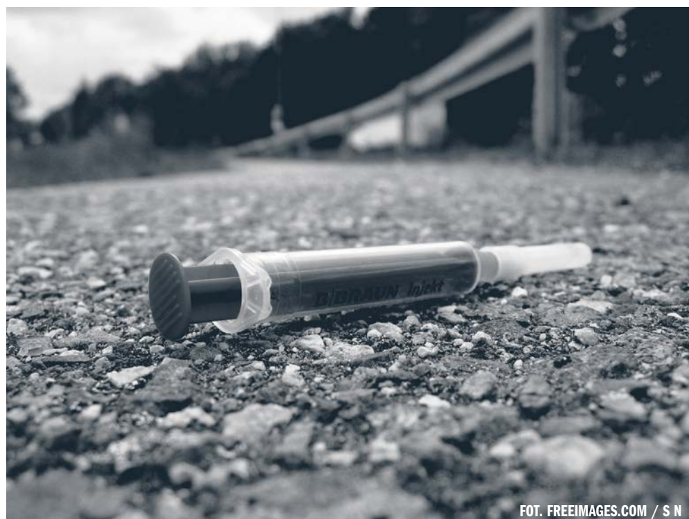
FOT. FREEIMAGES.COM / S N

PAP - NAUKA W POLSCE, LUDWIKA TOMALA ŹRÓDŁO: SERWIS NAUKA W POLSCE - WWW.NAUKAWPOLSCE. PAP.PL