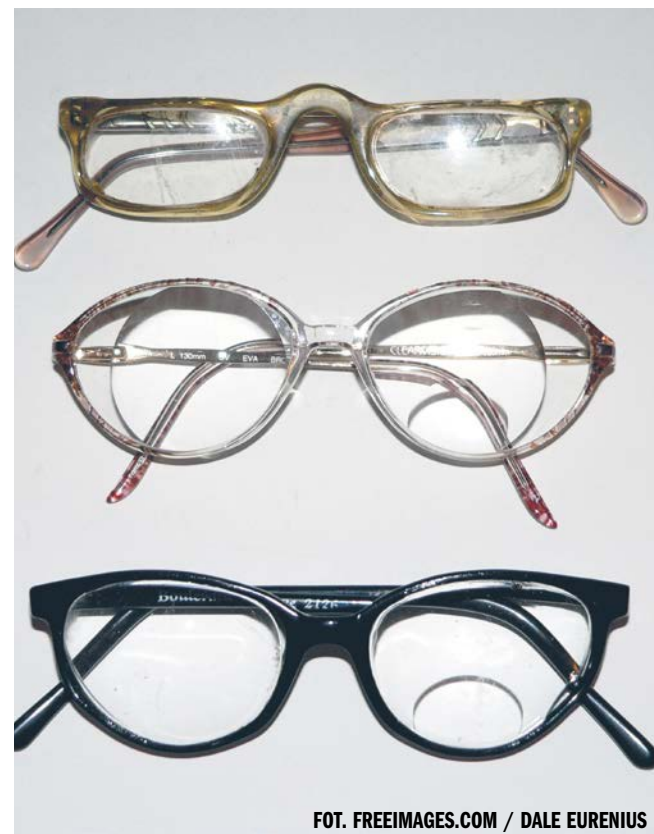
FOT. FREEIMAGES.COM / DALE EURENIUS

PAP - NAUKA W POLSCE, ZBIGNIEW WOJTASIŃSKI ŹRÓDŁO: SERWIS NAUKA W POLSCE - WWW.NAUKAWPOLSCE. PAP.PL