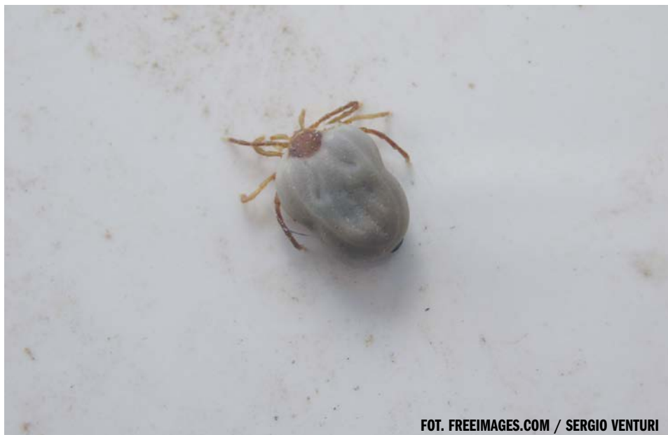
FOT. FREEIMAGES.COM / SERGIO VENTURI

PAP - NAUKA W POLSCE ŹRÓDŁO: SERWIS NAUKA W POLSCE - WWW.NAUKAWPOLSCE. PAP.PL