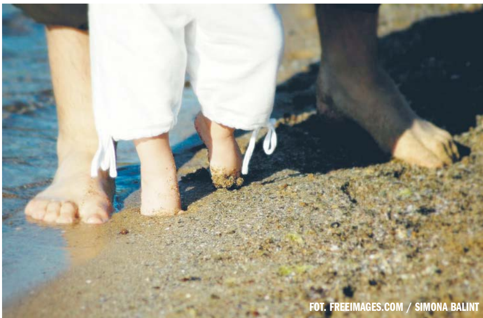
FOT. FREEIMAGES.COM / SIMONA BALINT

ŹRÓDŁO: SERWIS NAUKA W POLSCE - WWW.NAUKAWPOLSCE.PAP.PL