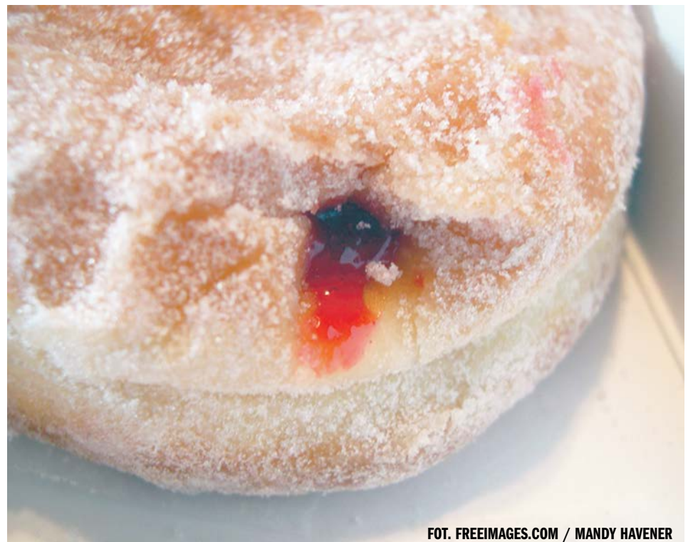
FOT. FREEIMAGES.COM / MANDY HAVENER

PAP - NAUKA W POLSCE ŹRÓDŁO: SERWIS NAUKA W POLSCE - WWW.NAUKAWPOLSCE. PAP.PL